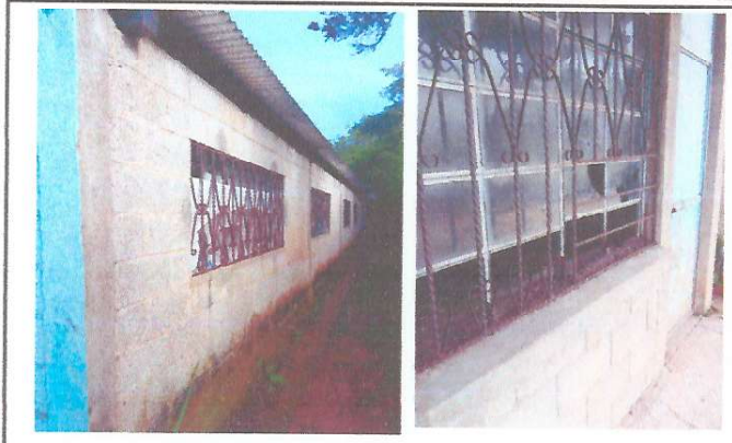
Foto 2: Mantenimiento de balcones, ventanas y puertas de todo el Establecimiento.