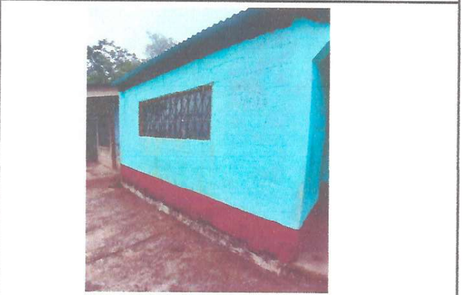
Foto 3: Mantenimiento de balcones, ventanas y puertas de todo el Establecimiento.