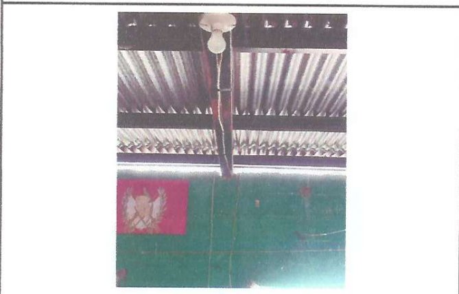
Foto 4: Mantenimiento de todo el sistema eléctrico del Centro Educativo.

Observación: Si es necesario se pueden agregar hojas adicionales y actualizar el número de hojas.